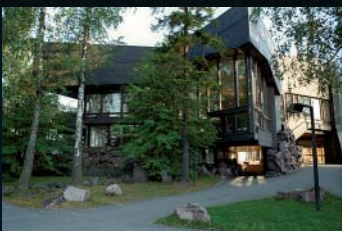
Dipoli, kongressi- keskuksen salit