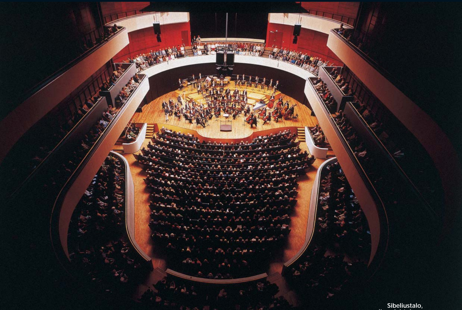
Sibeliustalo, salin valaistuksen ohjausjärjestelmä